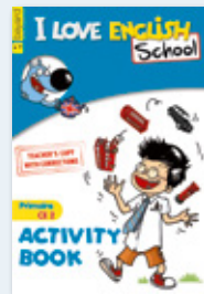
1 Activity Book corrigé pour chaque niveau (excepté pour le niveau débutant)