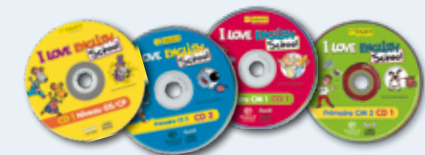
2 CD audio par niveau