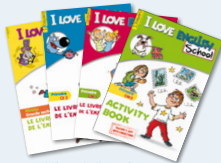
1 livre de l'enseignant