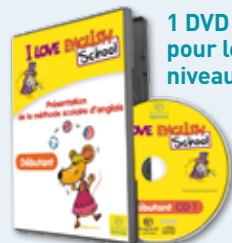
1 DVD pour le niveau débutant