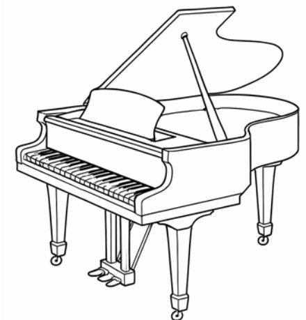
Un piano, une harpe et/ou un orgue peuvent compléter la formation