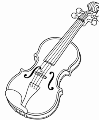
Les cordes : violons, altos, violoncelles, contrebasses...