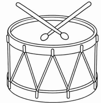
Les percussions : les tambours, les cymbales...