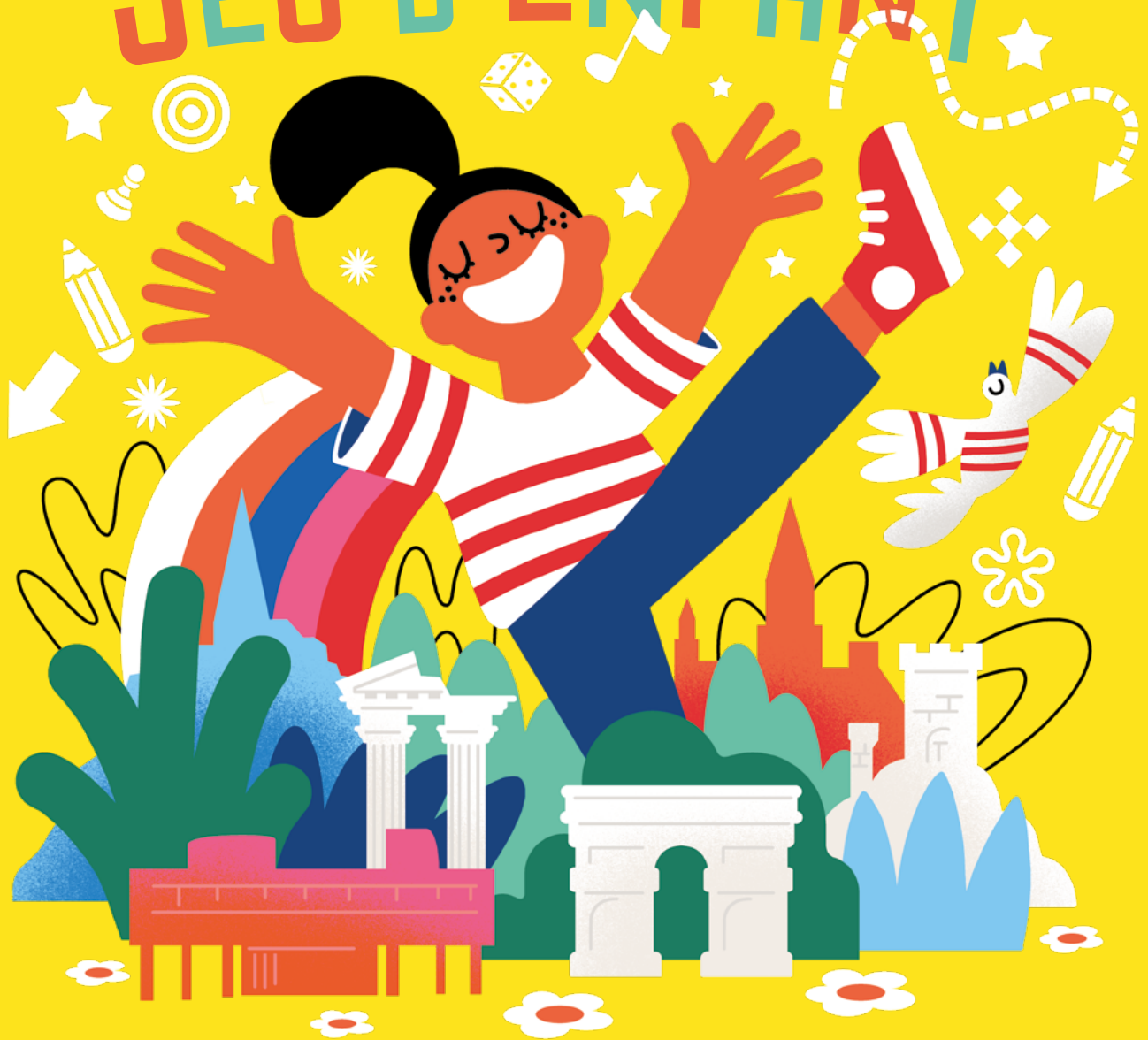
Illustration : Clod - Design graphique : Philzfer