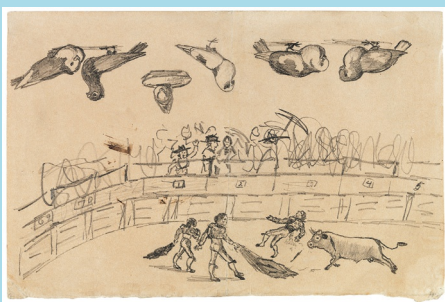
Corrida et étude de colombes, 1892

Ses premiers dessins représentent souvent des pigeons, des chevaux, des taureaux... Très observateur, le petit Pablo les reproduit parfaitement, de façon réaliste.