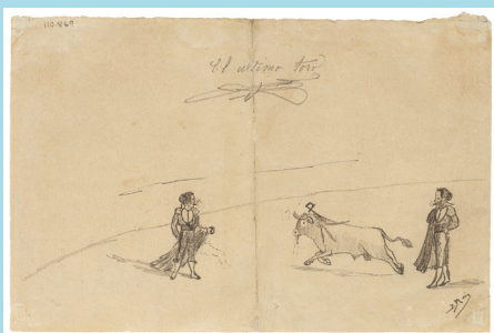
La corrida, 1892