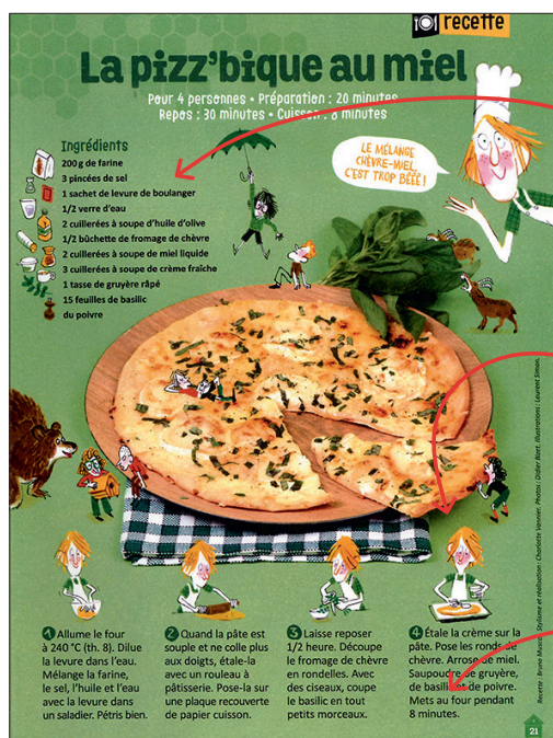
Extrait Astrapi n° 903 - 1 er mai 2018